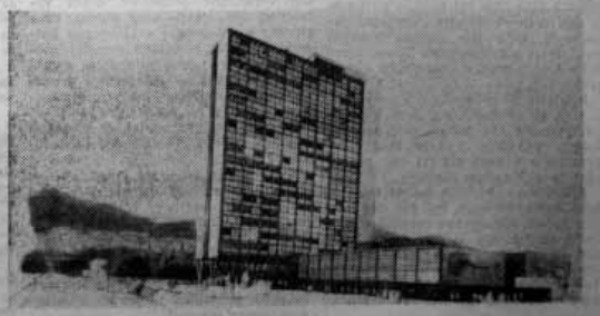
Výškové kolektivní dům a společenské a kulturní centrum Ruprechtic. Autori: vypracování návrhu: Hubička, Netolická, Špičák a Bulík.

Projektanti kolektivního domu ve Wolkerově ulici – Vacek, Ueda a Nykodoš – využívají jednoho z neobvyklých a nezaprávaných stavebních míst městského obvodu – segmentový tvar jejich rozdílného bloku a desítky a desítky podlažích, z čehož lze sta byty, naskrznu do lesního porostu hloukápař síňo spast liberecké učňů, napomáhá k organickému splnutí i okolní přírodu. Velkorozsahový, vypracovaný skupinový koncept, vypracovaný skupinou Patrní, Ulmann, Hubička a Netolická, obsahuje urbanistické řešení další bytové zástavby pro 6000 obyvatel v libereckých Ruprechticích. Autorům se podaří-