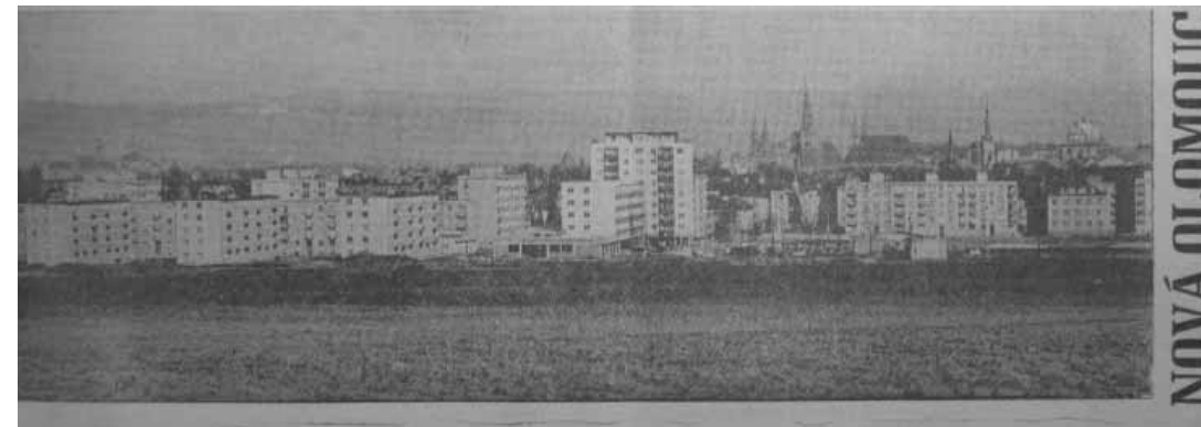
Nová Olomouc, snímek z deníku Stráž lidu , 7. 5. 1965

“The New Olomouc”, photo from the daily Stráž lidu , May 7, 1965