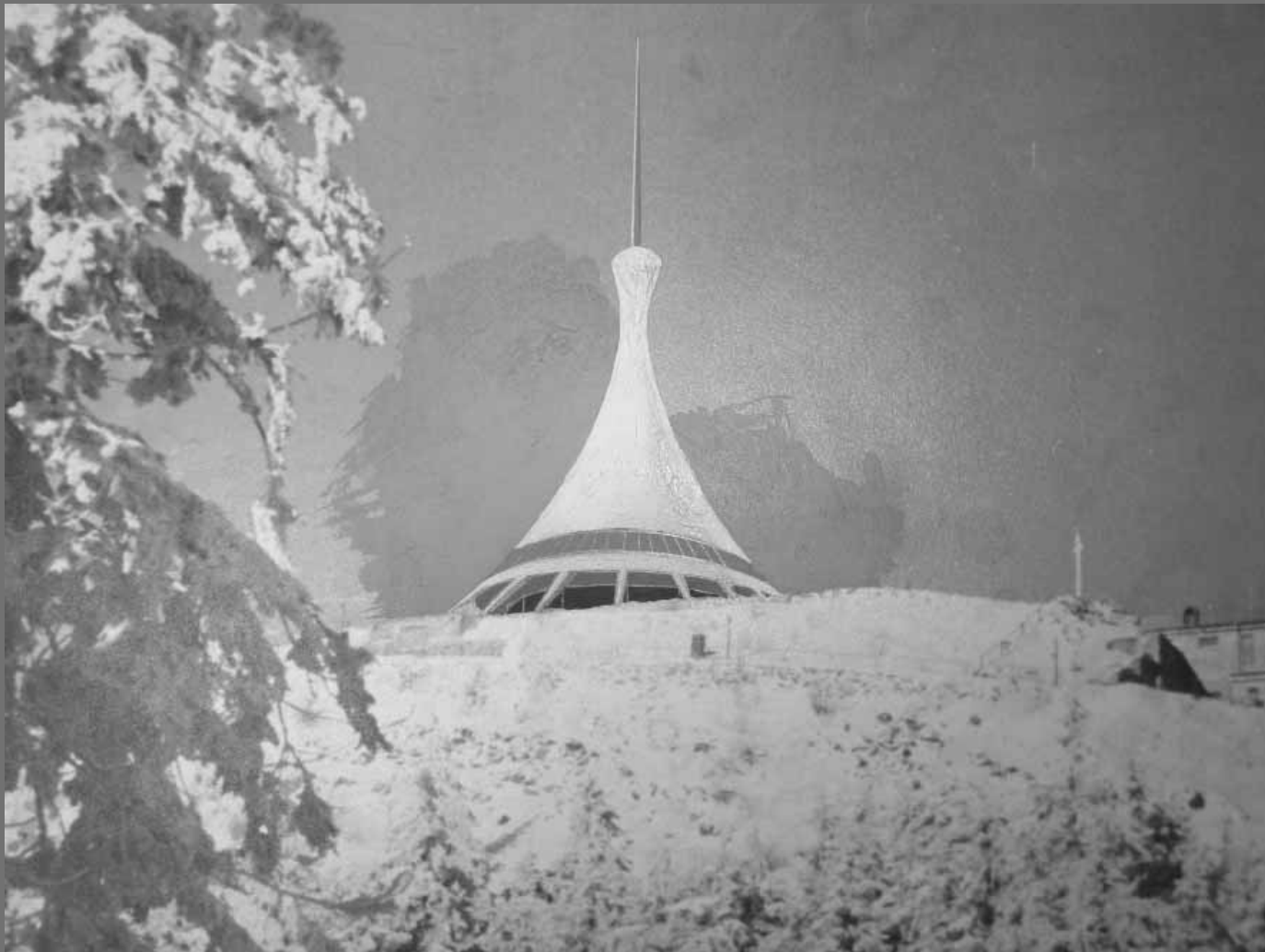
Karel Hubáček – Zdeněk Zachař: projekt televizní věže a horského hotelu na hoře Ještěd, 1963 Karel Hubáček – Zdeněk Zachař: design for the television mast and mountain-top hotel on Mount Ještěd, 1963